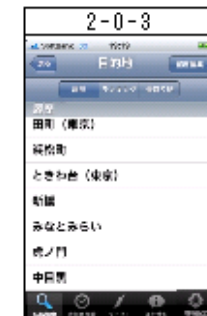
目的地の選択画面