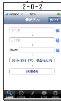
乗換案内ベース画面